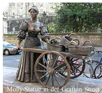
Molly-Statue in der Grafton Street