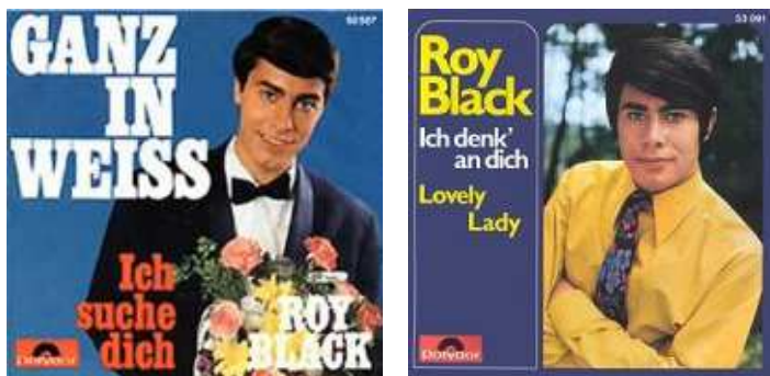
Die Original-Single-Cover von 1966 bzw. 1968