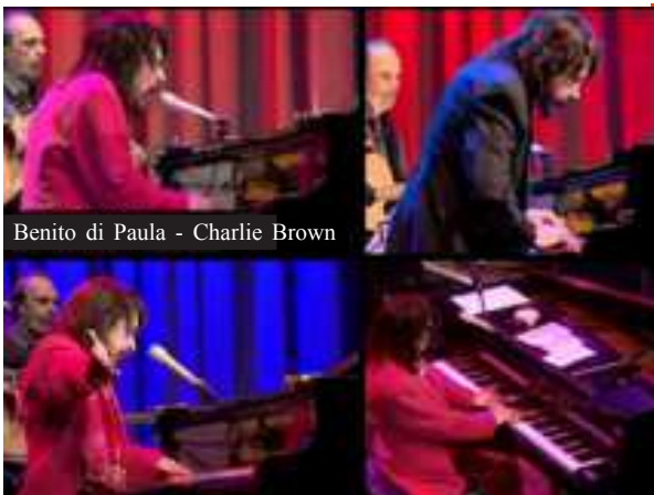
Benito di Paula - Charlie Brown

Schon früh wandte sich Jürgen Drews der Musik zu und erhielt bereits im Alter von 15 Jahren einen Preis als bester Banjo-Spieler Schleswig-Holsteins als Mitglied der Jazzband ‚Schnirpels‘. Mit dem damals bei der Plattenfirma Ariola angestellten Produzenten Giorgio Moroder entstanden zwei Langspielplatten – die erste LP unter dem Titel Kannibal Komix – und mehrere Singles. Nach einem kurzen Zwischenspiel als Schauspieler stieg Drews in den frühen 1970er Jahren als Sänger bei den Les Humphries Singers ein. 1973 startete er parallel dazu eine Solokarriere und hatte 1976 mit dem Hit Ein Bett im Kornfeld (einer Coverversion des Country-Songs Let Your Love Flow von den Bellamy Brothers) seinen Durchbruch.