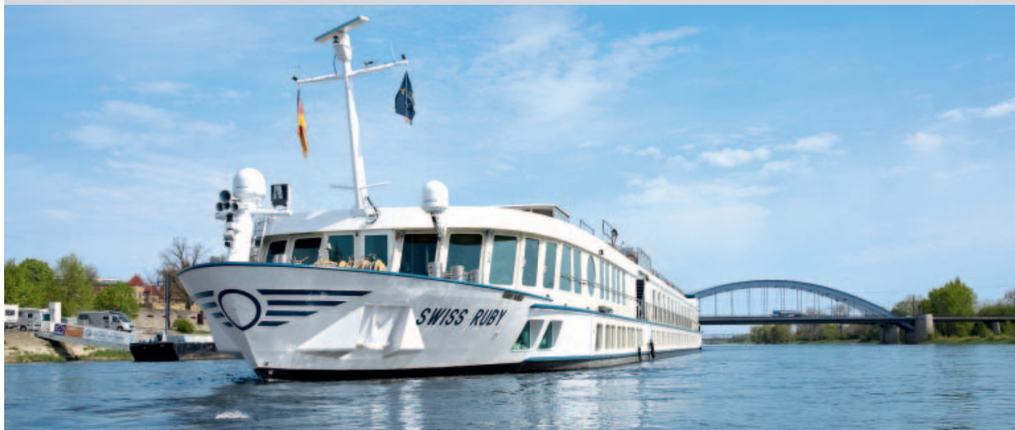
❖ Swiss Ruby

Klein, aber fein – damit sind zwei der wesentlichen Vorteile dieses Schiffes schon genannt. Aufgrund ihrer überschaubaren Größe und ihres geringen Tiefgangs kann die Swiss Ruby auch kleinere Flüsse und Kanäle befahren, wodurch z.B. Berlin als Ein- und Ausschiffungsort möglich wird. Gemütlich und stilvoll-elegant zugleich präsentieren sich die Einrichtungen: Sie wohnen ausnahmslos in Außenkabinen (davon die Hälfte mit französischem Balkon), speisen in einem gediegenen Restaurant und genießen gesellige Stunden im Aussichtssalon mit Bar oder auf dem Sonnendeck. Bei maximal 88 Passagieren ist die Atmosphäre familiär und der zuvorkommende Service erfährt eine noch persönlichere Note.